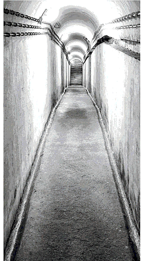
MONUMENTI A sinistra il bunker di Invillino ovest nel comune di Villa Santina (Ud). Qui sopra il corridoio all'interno della costruzione di Monte Croce Carnico

che, tra il ripristino di parte del Vallo Alpino del Littorio e la costruzione di nuove strutture in zone strategiche, a partire dagli anni Cinquanta il Friuli-Venezia Giulia constava di oltre mille fortificazioni riunite in complessi chiamati "sbarramenti" in montagna e "opere" in pianura. Nonostante le dimissioni di questi insediamenti militari conclusi nei primi anni Novanta, si è tutt'oggi di fronte ad un patrimonio storico unico di valenza internazionale; a valorizzarne tanto le strutture quanto il periodo storico ad esse collegato sono l'Università degli Studi di Udine e l'Associazione culturale Friuli Storia, la cui collaborazione ha dato il via a diverse iniziative.