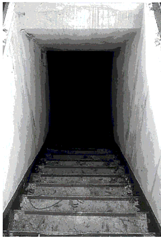
ISONZO L'ingresso del bunker di San Michele a Savogna

che, tra il ripristino di parte del Vallo Alpino del Littorio e la costruzione di nuove strutture in zone strategiche, a partire dagli anni Cinquanta il Friuli-Venezia Giulia constava di oltre mille fortificazioni riunite in complessi chiamati "sbarramenti" in montagna e "opere" in pianura. Nonostante le dimissioni di questi insediamenti militari conclusi nei primi anni Novanta, si è tutt'oggi di fronte ad un patrimonio storico unico di valenza internazionale; a valorizzarne tanto le strutture quanto il periodo storico ad esse collegato sono l'Università degli Studi di Udine e l'Associazione culturale Friuli Storia, la cui collaborazione ha dato il via a diverse iniziative.